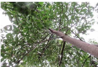
モッコクは、耐暑性に優れますが、やや耐寒性に弱く、関東南部以西で九州沖繩まで植栽できます。暗緑色で厚い葉と枝が蜜に茂るので、ボリューム感があります。横に広がって育つので繁栄を意味し、狭い場所には向きとわいれませんが、刈込みにも耐えるので、幅広い活用法がある樹木です。

このように五木として選ばれる庭木には、まるで花言葉のような意味合いがあります。単純な庭としてのデザインだけではなく、こうした意味を込めることが庭木を選ぶことでもあるのです。代表的な縁起木を表にしてみました。