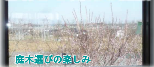
庭木選びの楽しみ